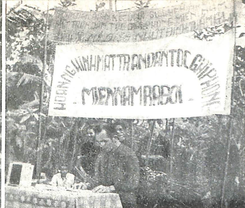
Население приветствует создание Национального фронта освобождения Южного Вьетнама.