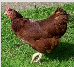
Курица породы род-айленд